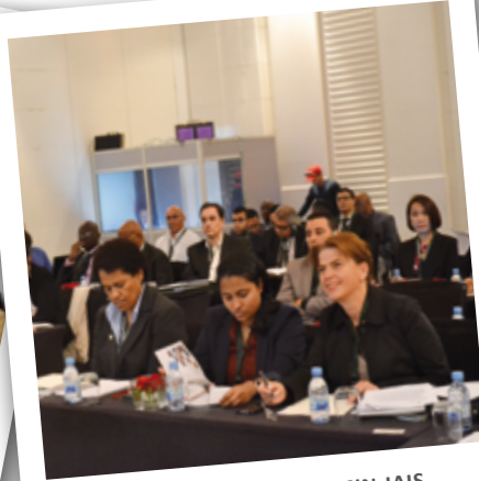
5o Foro de Consulta de A2ii-MIN-IAIS [Casablanca, Marruecos]