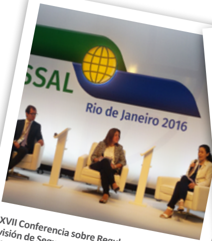
XVII Conferencia sobre Regulación y Supervisión de Seguros IAIS-ASSAL en América Latina [Rio de Janeiro, Brasil]