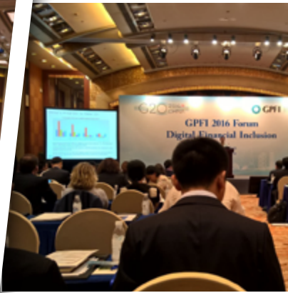
Asociación Global para la Inclusión Financiera (GPI) Foro y Plenaria [Chengdu, China]