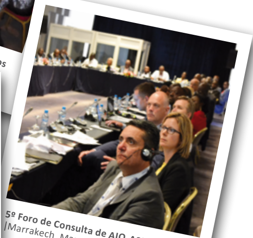
5º Foro de Consulta de AIO-A2ii-MIN-IAIS [Marrakech, Marruecos]