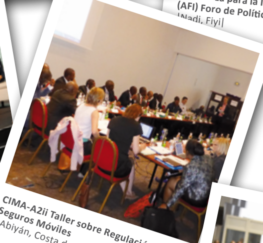
CIMA-A2ii Taller sobre Regulación de los Seguros Móviles [Abiyán, Costa de Marfil]