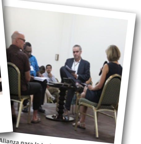
8a Alianza para la Inclusión Financiera (AFI) Foro de Política Global [Nadi, Fiji]