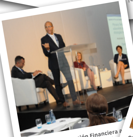
Seminario de Educación Financiera a Consumidor [Sandton, Sudáfrica]