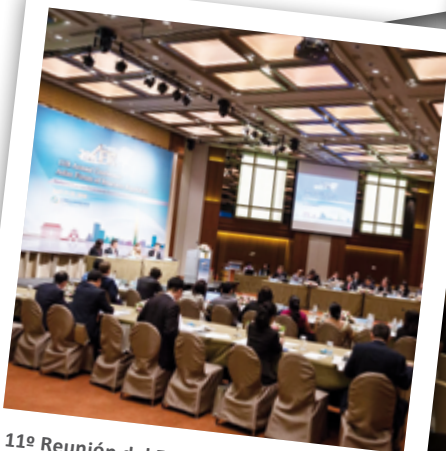
11ª Reunión del Foro Asiático de Reguladores de Seguros (AFIR) [Taipéi, Taiwán]